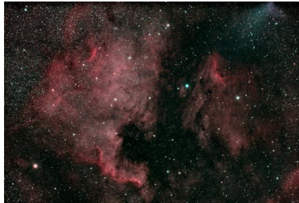
oben: Nordamerikanebel (Jürgen Biedermann) unten: Rosettennebel (Andreas Eisele)