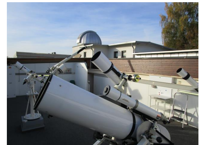
🕒 Beobachtungsplattform mit Blick auf die Kuppel

Mit unserer CCD-Kamera können wir Astrofotos für den Einsatz am Computer erstellen.