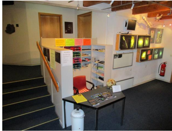
🕒 Eingangshalle mit Kassenbereich