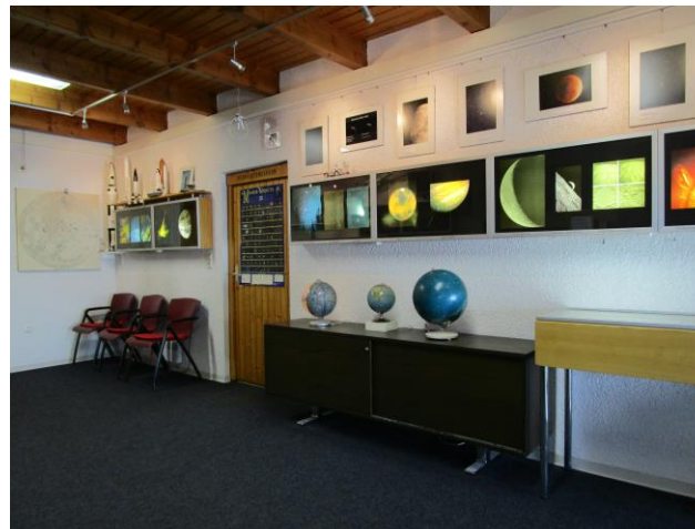
🕒 Zugang zur Beobachtungsplattform

Unsere Hauptaufgabe sehen wir darin, Jugendliche und Erwachsene mit der faszinierenden Welt der Sterne vertraut zu machen. Dazu bieten wir geführte Himmelsbeobachtungen mit den Fernrohren, Multimediavorträge sowie den Einsatz einer Planetariumssoftware an. Bei uns finden Sie kompetente Ansprechpartner bei Fragestellungen rund um die Astronomie und zu Fernrohren sowie zur Astrofotografie oder erhalten Tipps für eigene Beobachtungen.