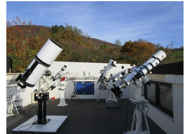
🕒 Beobachtungsplattform (Ostteil)