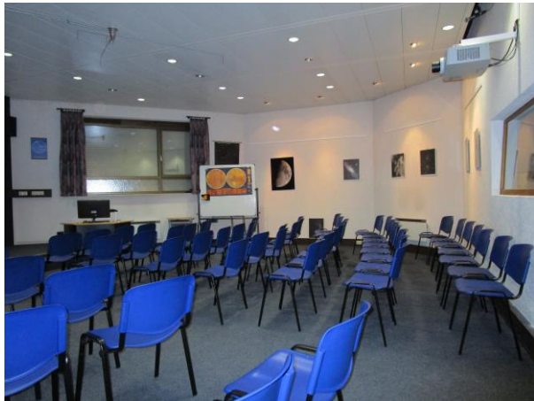
🕒 Vortragssaal für 80 bis 90 Personen

Die Sternwarte wurde nach neunmonatiger Bauzeit im Frühjahr 1989 eingeweiht und im Jahr 1995 auf die jetzige Größe ausgebaut. Sie ist eine der größten Privatsternwarten Süddeutschlands und gehört den Sternfreunden Donzdorf e.V.. Sie wird von Vereinsmitgliedern ehrenamtlich betrieben. Finanziert wurde sie überwiegend durch Geld- und Sachspenden.