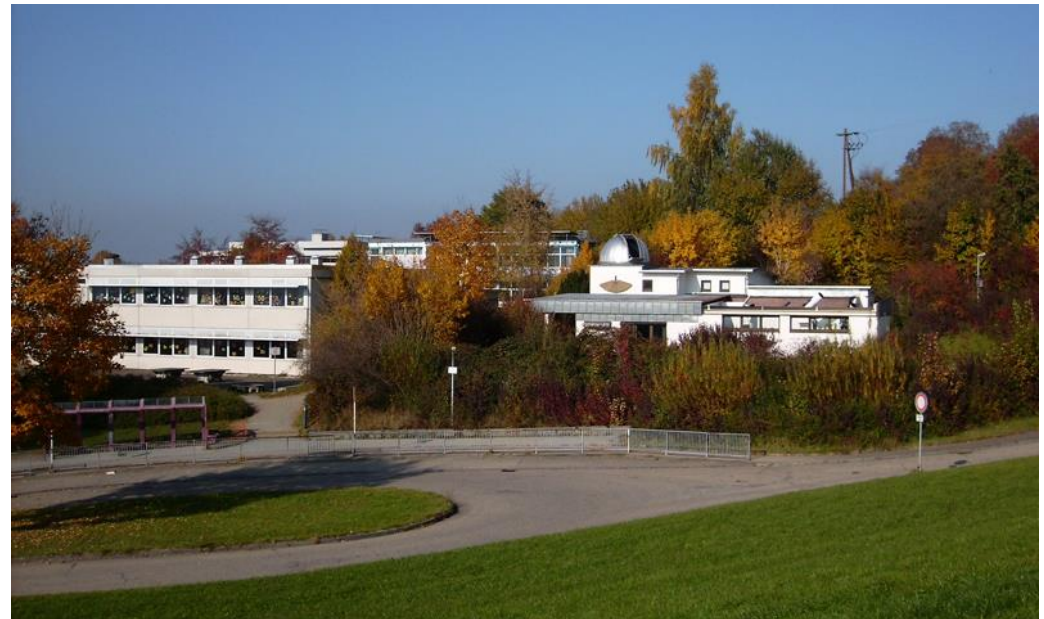
Wartehäuschen an der Bushaltestelle (linker Bildrand) mit dem direkt daneben beginnenden Weg zur Sternwarte

Der Einlass erfolgt bei allen Veranstaltungen jeweils etwa 15 bis 20 Minuten vor Beginn. Nach dem Beginn der Veranstaltung ist ein Einlass nicht mehr möglich!