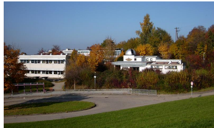
Wartehäuschen an der Bushaltestelle (linker Bildrand) mit dem direkt daneben beginnenden Weg zur Sternwarte

Der Einlass erfolgt bei allen Veranstaltungen jeweils etwa 15 bis 20 Minuten vor Beginn. Nach dem Beginn der Veranstaltung ist ein Einlass nicht mehr möglich!